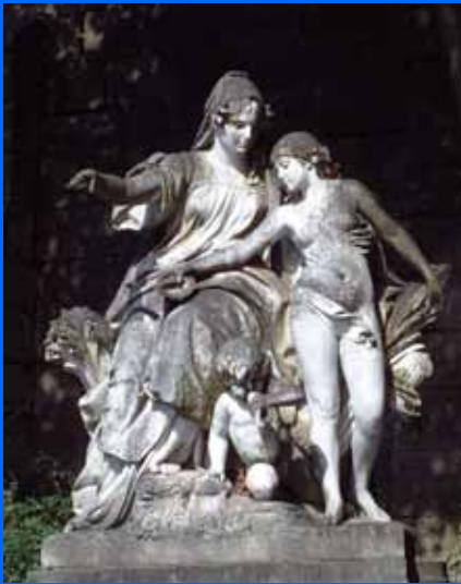
Skulptur der Mutter Baar, die ihrer Tochter, der Donau, den Weg nach Osten weist

der Donauquelle zur Hauptstadt des Fürstlich Fürstenbergischen Territoriums. In die Landschaft Baar sind die Fürstenberger nach Übernahme des Besitzes der Zähringer im Jahr 1218 gekommen. Wer den Fürsten zu Fürstenberg unterstellt, dass sie die neben ihrem Schloss in Donaueschingen gelegene Quelle zur Donauquelle hochstilisiert haben, negiert die geschichtlichen Fakten. Diese belegen das Gegenteil: Die Grafen zu Fürstenberg haben sich bei der Auswahl des Bauplatzes für ihr Schloss für den Standort neben der Donauquelle entschieden, weil sie deren Bedeutung richtig einzuschätzen wussten. Der bessere und ursprünglich auch vorgesehene Standort auf dem Hügel, auf dem heute das Gebäude der Fürstenberg-Sammlungen steht, wurde zugunsten des Standortes neben der Donauquelle wieder verworfen.