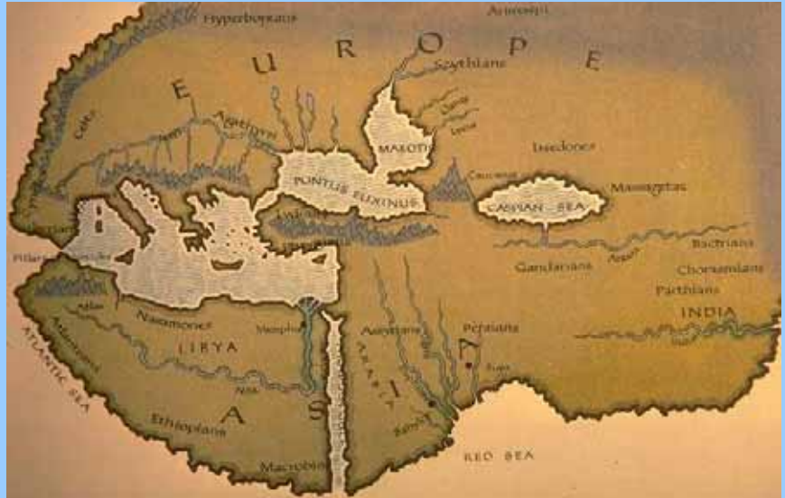
Das Weltbild zur Zeit Herodots

zutreffend, dass der Name Pföhren römische Wurzeln hat und auf den Begriff Forum zurückgeht. In einer Hinsicht kann die Aussage von Herodot allerdings nicht infrage gestellt werden: Die Donauquelle lag damals tatsächlich im Land der Kelten. Die Baar und das Gebiet des heutigen Donaueschinger waren zur Zeit von Herodot nämlich von den Kelten besiedelt.