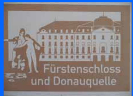
Hinweisschild auf die Donauquelle in Donaueschingen an der Autobahn A 81