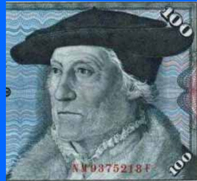
Sebastian Münster auf dem ehemaligen 100-DM-Schein

wird fast ausschließlich durch dieses Werk begründet.