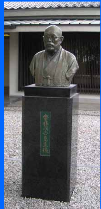
Saito-Gedenkstein vor dem Saito-Mokichi-Museum in Kaminoyama/Japan

Die Stadt Kaminoyama hat aufgrund dieser Reisebeschreibung und der Gedichte zur Donauquelle 1994 der Stadt Donaueschingen eine Städtepartnerschaft angetragen. Diese wurde 1995 vertraglich vereinbart und wird seither intensiv gepflegt.